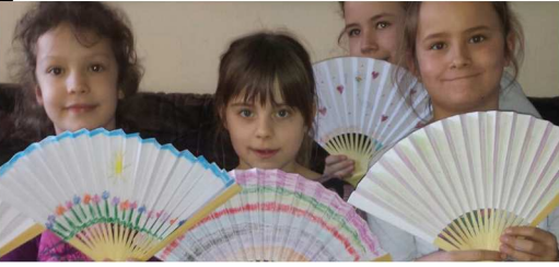
Weltgebetstag der Kinder