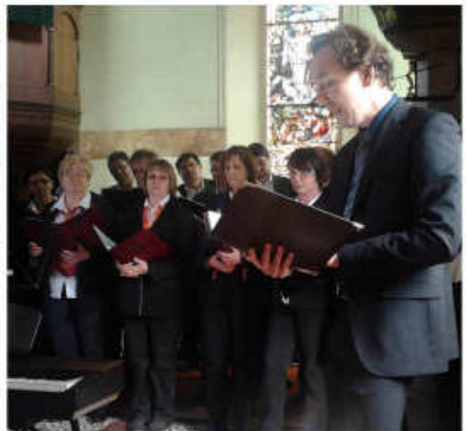
Konzert in Tünschütz