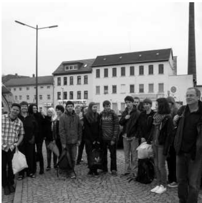
Abfahrt auf dem Eisenberger Busplatz

19 Teilnehmer im Alter von 16 bis 62 Jahren waren vom 1. bis 5. Mai in Hamburg zum 34. Deutschen Evangelischen Kirchentag und haben fünf erlebnisreiche Tage verbracht.