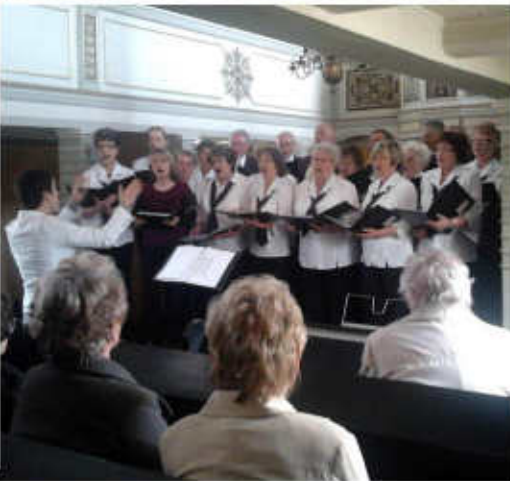
Konzert in Hainspitz