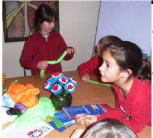
Weltgebetstag der Kinder