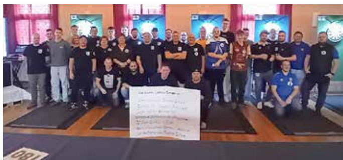
Aufstellung aller Dartspieler vor Beginn des Turniers.