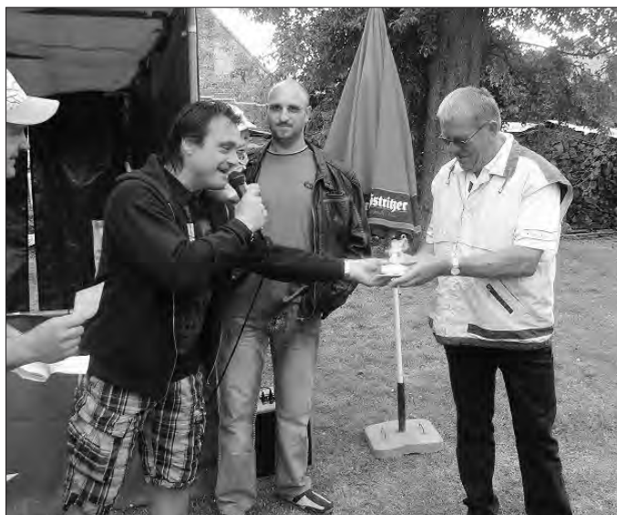
Preisübergabe / Schätzwettbewerb

Der kleine (und große) Appetit bzw. Durst konnte mit frisch gebackenem Kuchen, leckeren Etdorfer Rostbräteln und Bratwürsten sowie Bier vom Fass gestillt werden.