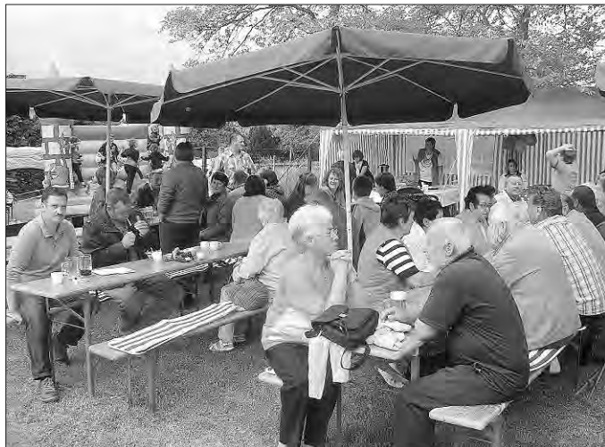
Festwiese mit Blick auf Hüpfburg und Kuchenzelt