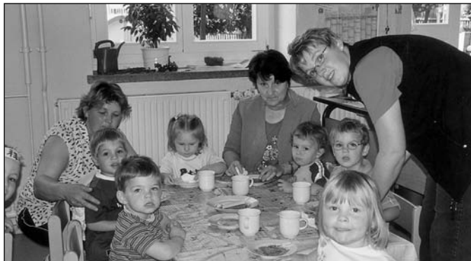
Die Kinder des Kindergartens Thiemendorf

Ganz besonders möchten wir Kinder uns aber bei den Feuerwehrleuten von Thiemendorf bedanken. Sie sind immer da, wenn sie gebraucht werden. Ohne sie wäre so manche Veranstaltung für uns nicht möglich, auch das Sportfest mit den Kindern vom Königshofener Kindergarten, das am 19. Juni für uns den Frühling beendete.