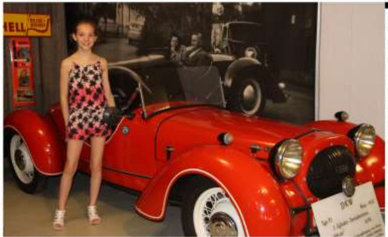
Konfirmanden in Chemnitz