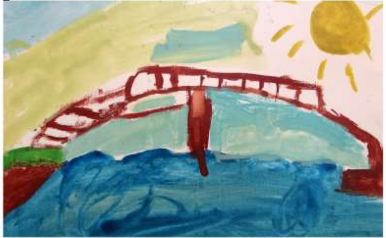
Kinderbilder zur Jahreslosung