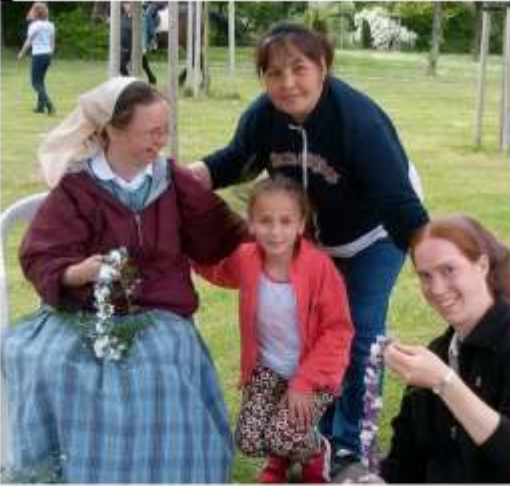
Frühlingsfest mit Flüchtlingen