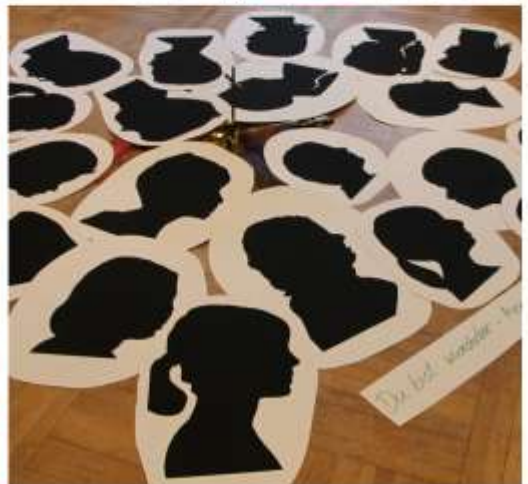
Kinderfreizeit in Schönburg an der Saale: „Du bist wunderbar!“