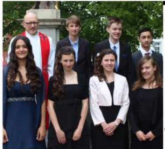
Konfirmation in Eisenberg