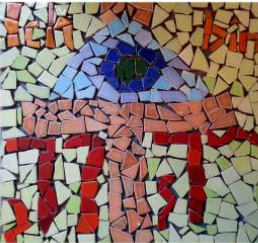
Kinderbibelwoche in Eitzdorf